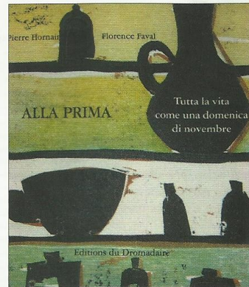
Pierre Hornain - immagini di Florence Faval, Tutta la vita come una domenica di novembre/ Il cavallo di Michele , Venezia, Editions du Dromadaire, 2007, pp. 20, Euro 12.00